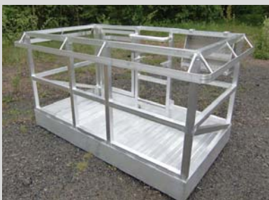
HM utför även licenssvetsning av aluminiumkonstruktioner. Bilden visar en SVABO aluminiumkorg tillverkad för SRS Sjöländers i Osby.

Alla typer av ombyggnation och service för råsands- samt kallhårdande gjuterier. Nykonstruktion i CAD av råsandsberedningar och råformanläggningar.